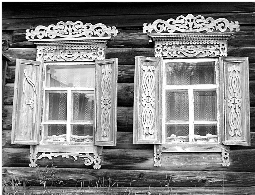
Окна татарского дома, построенного в середине XX в. Деревня Черемшанка Заларинского района. Фото Е. Колгановой, 2011 г.

дельную топку. Подобная печь была традиционна для татарских жилищ метрополии и использовалась для приготовления национальных блюд и чая. Во дворе некоторых усадеб татар-переселенцев также имелась печь с встроенным в нее казаном, и в летнее время многочисленная родня устраивала совместные трапезы.