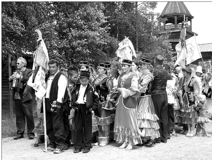
Татары в национальных костюмах на празднике Сабантуй в музее «Тальцы». 2011 г.

очпочмаки — пироги с мясной начинкой. Татарские торжества не обходятся без сладкого чэкчэка (является обязательным свадебным угощением).