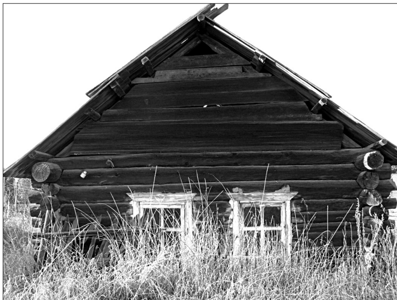
Дом татарских переселенцев, построенный в 1913 г. Деревня Черемшанка Заларинского района. Фото Е. Колгановой, 2012 г.

Моноэтнические татарские деревни Предбайкалья начала XX в., как и большинство переселенческих поселков, появившихся в этот период, имеют регламентированную планировку: ровные, прямые улицы с двухрядной застройкой, значительной — 40–45 м — шириной улиц. В первые годы после заселения хозяйственных построек в усадьбах татар было минимальное количество — только самые необходимые: амбар, стайка, навес для