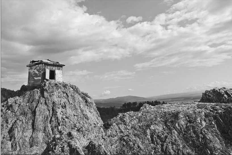
Бумхан на Белом камне (справа — площадка, на которой стояла православная часовня).

шена. 17 апреля 1905 года Николаем II был издан именной высочайший указ «Об укреплении начал веротерпимости». Указом признавался юридически возможным и ненаказуемым переход из православия в другую, нехристианскую, веру тех лиц, которые лишь числились православными, а в действительности исповедовали веру, к коей до обращения в православие принадлежали сами они или их предки. Кроме того, впредь в официальных актах запрещалось именовать «ламаитов» идолопоклонниками и язычниками.