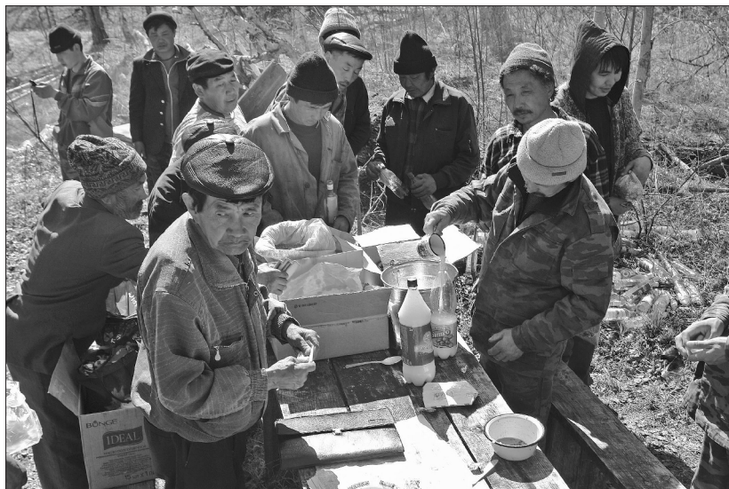
Распределение ритуальной еды. Фото Ю. Лыхина, 2008 г.

канчивается. К 17 часам на поляне у Белого камня все действие завершилось. «Водки мало было. Раньше боролись, коня забивали», — подводит итог тайлгану шаман. Коня «приносили» в последний раз в 1937 году, с той поры «только барана». Кроме того, раньше обрядовые действия на поляне сопровождались соревнованиями по борьбе и конными скачками.