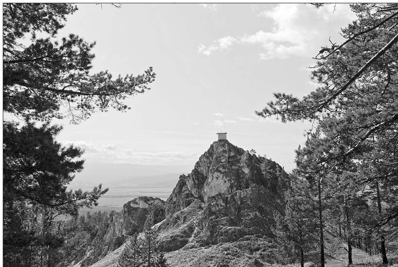
Белый камень. Фото Ю. Лыхина, 2008 г.

мися сюда из Монголии в начале XVII века. Было их при переселении всего два рода. Некоторые из монголов кочевали тогда «в тех местностях, где теперь деревни Олха и Введенщина». С приходом сюда русских в середине XVII века, с основанием и развитием Иркутска они были вытеснены и «осели на занимаемой ими теперь местности Торской степи». В 1870-х годах их потомки буряты считали себя в девятом колене (8, с. 559–560).