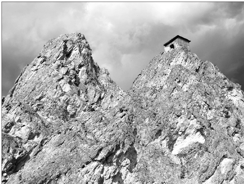
Две вершины Белого камня. Фото В. Петрова, 2008 г.

До 1820-х годов православные миссионеры не сильно преуспели в своей деятельности в Торской котловине. К 1827 году крещеных бурят во всем Тункинском ведомстве насчитывалось всего 250 человек, из которых число торских бурят было, очевидно, совсем незначительно. Однако в апреле 1827 года, когда в православие обратился влиятельный бурят из 1-го куркутского рода Бархонов (по крещении Лука Михайлов), наступил перелом-