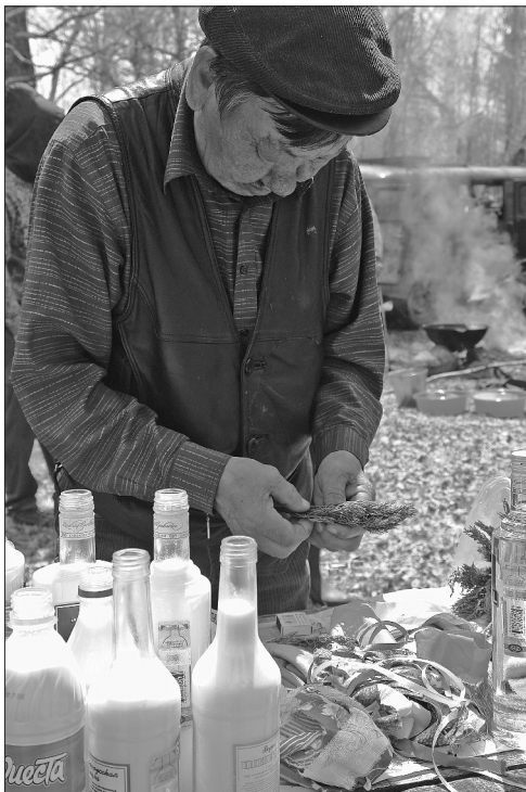
Освящение ритуальной пищи. Фото Ю. Лыхина, 2008 г.