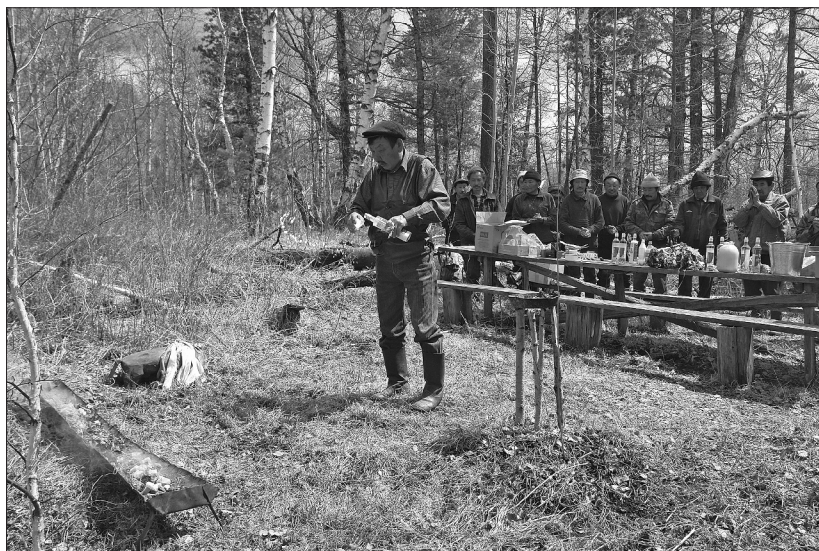
Во время тайлгана. Фото Ю. Лыхина, 2008 г.

13 мая к 11 часам утра возле далахайского магазина собралось около 20 человек, в основном из селений Далахай и Хонгодоры, которые отправились к Белому камню на двух УАЗиках и трех лошадях. В предыдущие годы ездило 30–35 человек, в текущем помешали случившиеся в тот день похороны.