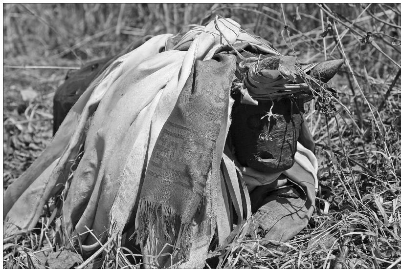
Скульптура Буха-нойона.