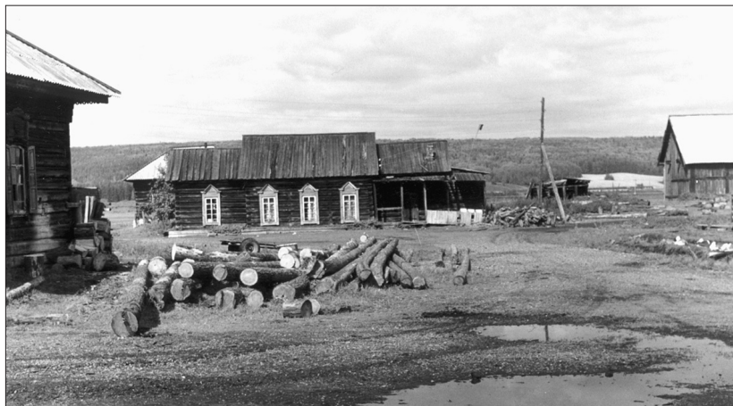
Сполошинская Ильинская церковь. 2001 г.