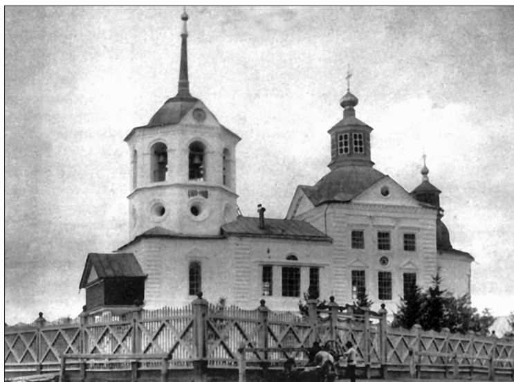
Петропавловская Спасская церковь. 1913 г.