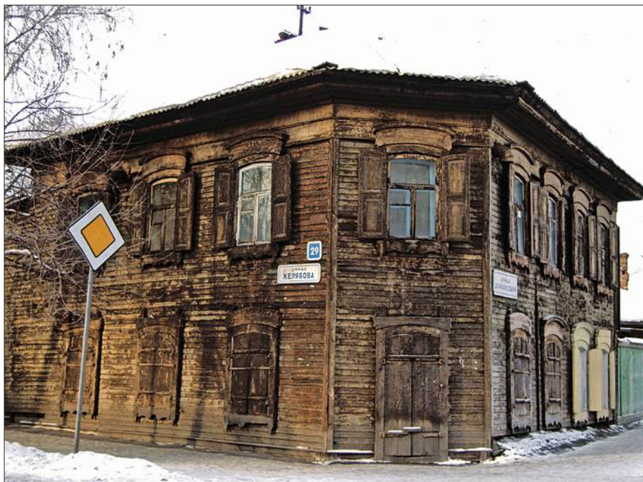
Здание, в котором жил И.А. Кусков, г. Иркутск