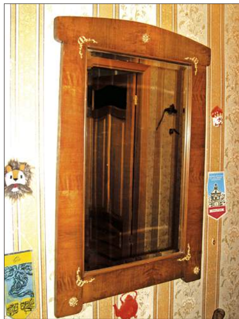
Зеркало, начало XIX в. (частная коллекция)