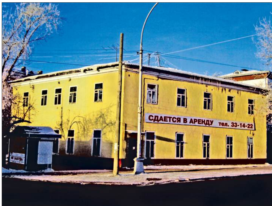
Офицерский корпус Американских казарм, г. Иркутск