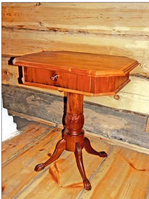
Столик, первая половина XIX в. (фонды ГУК АЭМ «Тальцы»)