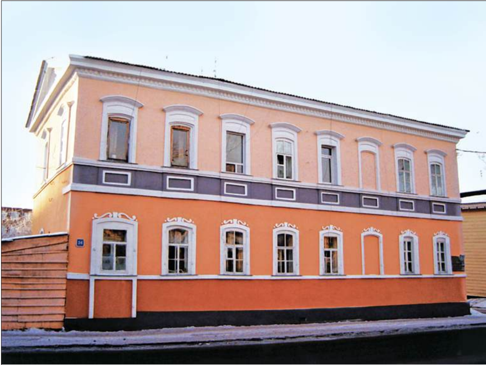
Здание конторы Российско-американской компании, г. Иркутск

В последние годы у иркутских историков, краеведов, музейщиков и общественности возникла идея, обретающая черты конкретного проекта: создание на базе здания бывшей конторы Российско-американской компании музейного центра с целью музеефикации сохранившихся артефактов, организации экспозиций и выставок, формирования архива из документов оригиналов и копий, в общем, создание в широком смысле музейного центра по русской колонизации Северо-Запада Американского континента, под рабочим названием музейный центр «Русская Америка».