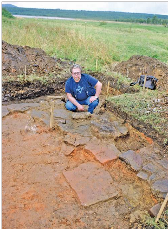
Раскопки Тальцинского стекольного завода. Иркутская область, пос. Тальцы. 2004 г.

Россию и Соединенные Штаты Америки связывает много замечательных событий. Яркими и значительными страницами в истории наших стран являются освоение в конце XVIII – первой половине XIX в. русскими первопроходцами Алеутских островов, полуострова Аляска с созданием на этих территориях первых крупнейших