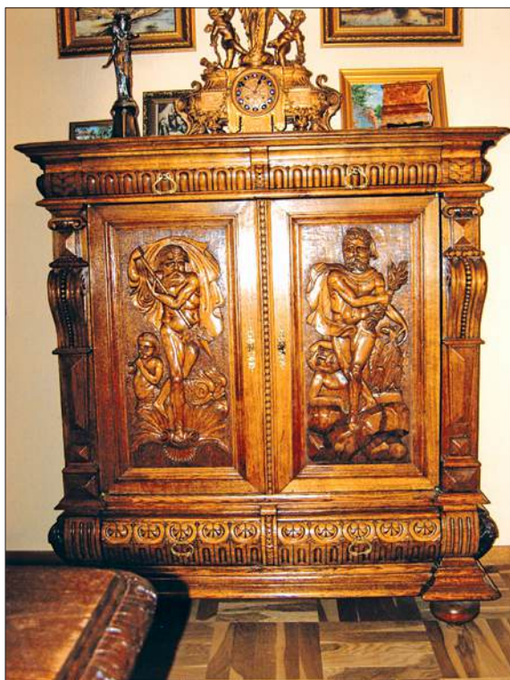
Поставец, конец XVIII – начало XIX в. (частная коллекция)