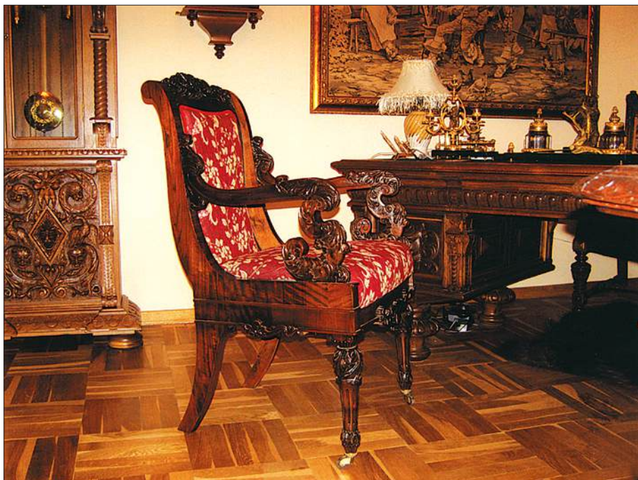
Кресло, начало XIX в. (частная коллекция)