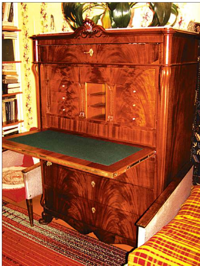
Бюро, первая половина XIX в. (частная коллекция)

Уже сейчас при предварительной проработке вопроса о создании на базе данного здания музейного центра «Русская Америка» можно предложить разместить в нем общественный российско-американский культурный центр, экспозиции выставки, архивный комплекс, библиотеку и кафе-ресторан «Русская Америка».