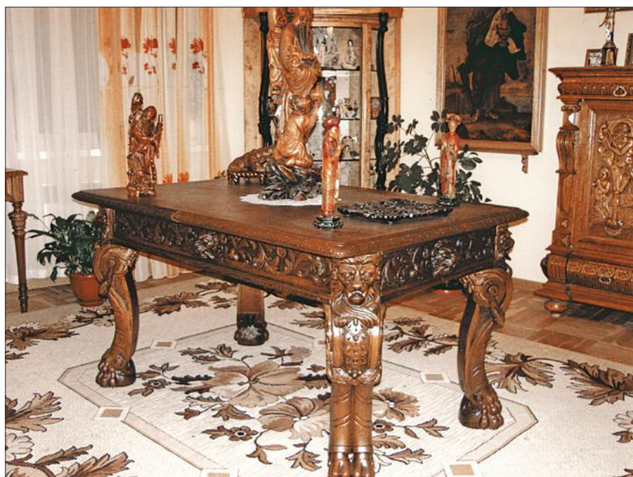
Стол, начало XIX в. (частная коллекция)