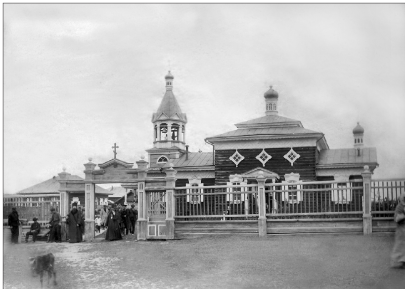
Мухтовская Николаевская церковь. 1913 г.

горбачей*“ и когда там главною целью была нажива и поклонению золотому тельцу, о. Никанор, несмотря на свои еще молодые годы, не погрузился в бездну веселия и роскоши, а с присущей ему энергией проповедывал слово Божие, звал к лучшей христианской жизни, взялся за украшение тогда еще бедного Витимского храма и, располагая к пожертвованию состоятельных лиц, довел храм до приличного вида, подобающего дому Божию. Расчетливый и экономный во всем, он сумел увеличить и церковные капиталы. Обратил серьезное внимание на школьное дело, воспитывая юношество „развратного тогда Витима“ в страхе Божиим. За свое ревностное и плодотворное служение о. Никанор не раз был отличаем, как своим начальством, так и прихожанами, получая от первого награды, а от вторых ценные подношения. Отличаясь ровным, спокойным характером, тактом, всегда жизнерадостный, покойный был желанным гостем во всех слоях Витимского общества. Умел ладить с людьми: у него не было ни раба, ни свободного, ни богатого, ни бедного, а