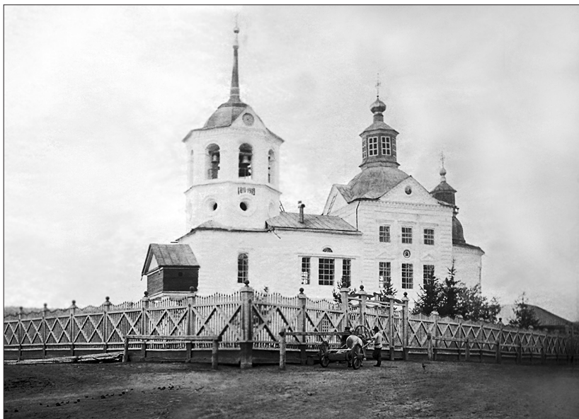
Петропавловская Спасская церковь.