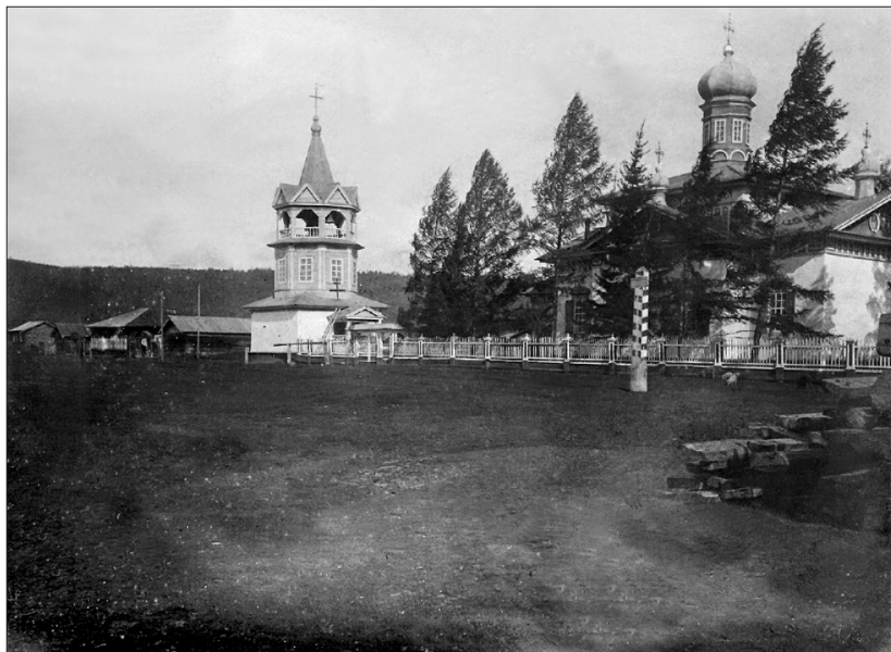
Чечуйская Воскресенская церковь. 1913 г.

тцати лет не имел свидания. Для того осмеливаюсь особу Вашего Преосвященства всепокорнейше просить о увольнении меня в город Енисейск для свидания с оными находящимися в нем моими родственниками» (10).