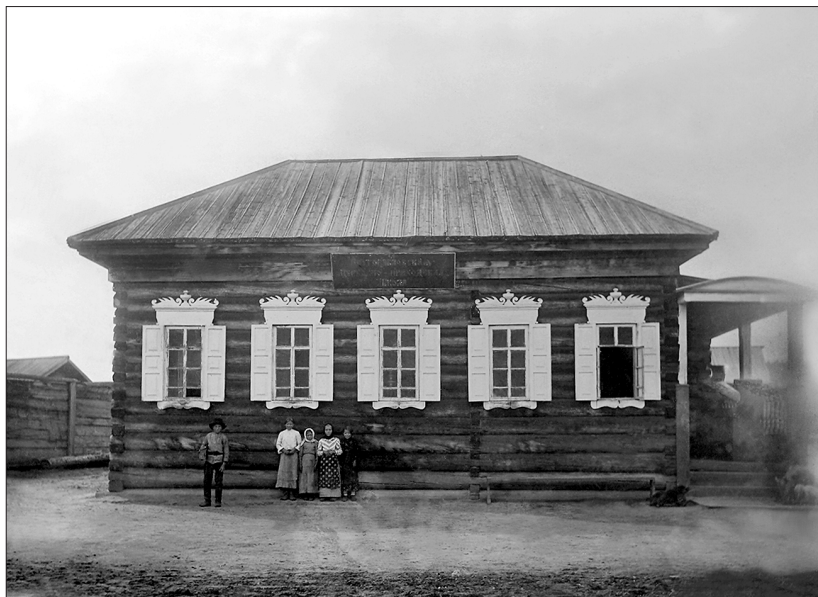
Петропавловская церковно-приходская школа.