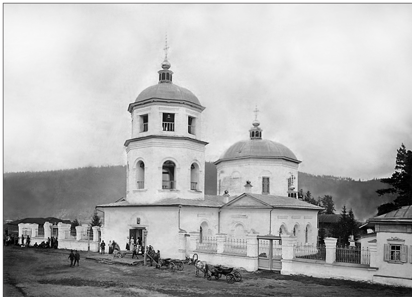
Киренский Спасский собор. 1913 г.

решено было перенести приходский храм на 10 верст выше по течению Лены, построив его в деревне Захаровской. Новый храм, заложенный в 1801 году и освященный во имя Спаса Нерукотворного и святых апостолов Петра и Павла, дал новое название деревне Захаровской — Петропавловский погост (ныне село Петропавловск).