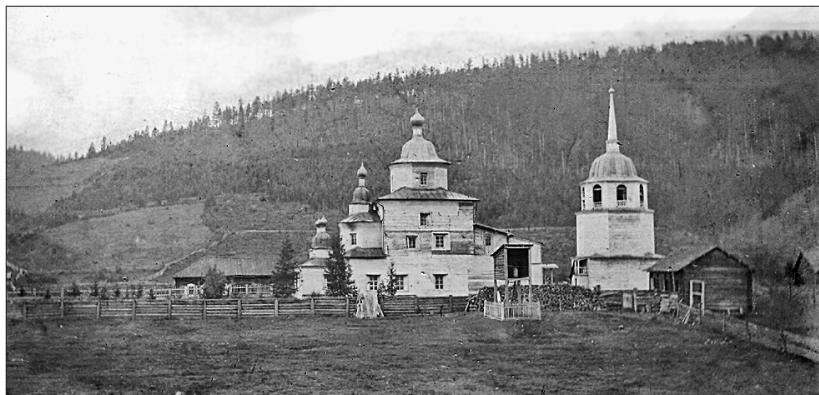
Илимская Спасская церковь. 1913 г.

Этот период деятельности отца Петра продолжался в течение почти 15 лет. Современник П.П. Пономарёва свидетельствовал: «Тому, кто знаком с нравственным состоянием населения этого края со времени открытия в соседстве его золотопромышленности, кто хоть понаслышке знает о таких деморализующих пунктах, находившихся в районе благочиннической деятельности о. Петра, как Витим, Мухтуя и др., тому будет понятно, какое тяжелое нравственное состояние должен был испытывать, ввиду этого зла, добрый пастырь, не имеющий никаких других средств на борьбу с ним, кроме одного своего слова... Тот, кто хорошо знаком с географией Киренского округа, в частности, с районом благочиннического округа 2-го участка, заключающего в себе разбросанное население на добрую тысячу верст, при отсутствии в крае сколько-нибудь сносных путей сообщения, в особенности по таким захолустьям, как Нижняя Тунгуска, — тот легко может себе представить всю трудность служения о. Петра в отдаленнейшем уголке его негостеприимной родины, при ежегодных двухкратных объездах его по своему обширному благочинническому участку» (18).