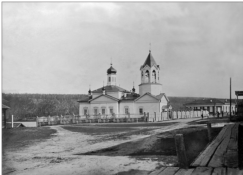
Витимская Спасская церковь. 1913 г.

спектор П[етр] П[латонович] оставил о себе добрую память. Он был строг, но справедлив. Я не помню, чтобы он кого-либо наказал несправедливо. Мы боялись его и, можно сказать, трепетали, но вместе с тем и глубоко уважали. Бывало, накажет тебя строго, а по-нынешнему, может быть, и жестоко за шалость или незнание урока, а придешь к нему на дом, он тебя и чаем с сахаром напоит и оладьями накормит, и ты все забудешь; еще хвастаешься, как тебя инспектор угостил» (15).