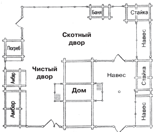
Обмерный чертеж усадьбы Я. Непомилуева, выполненный Г.Г. Оранской

крытому типу двора, был заменен на открытый, а также были значительно изменены планировка усадьбы и набор хозяйственных построек. Какова же причина столь кардинальных изменений? Думается, нужно обратиться к 60–70-м годам XX века, когда шло формирование музея «Тальцы». В то время в Предбайкалье музейных комплексов под открытым небом еще не было. Музей