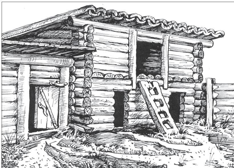
Стайки с повестью. Художник В. Нефедьев

имущество объединения родственных семей в одно хозяйство в составе одной усадьбы и людская численность в одной усадьбе пошла на убыль.