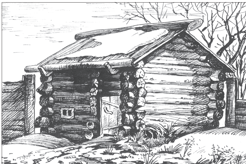
Баня по-черному. Художник В. Нефедьев

Вполне закономерен интерес к численности семьи и ее изменению во времени. О численности семьи Непомилуевых в XVIII–XIX веках сегодня никаких сведений не сохранилось. Однако можно предположить, что он колебался в пределах 25–40 человек. Большому составу семьи, а точнее — группировке в одной усадьбе нескольких родственных семей, способствовала законодательная база Российского государства того времени. Налоги тогда брали со двора. С переходом на подушный налог, естественно, было утрачено пре-