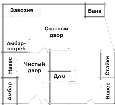
Чертеж усадьбы Я. Непомилуева после реставрации

Строительство усадьбы началось в конце XVIII