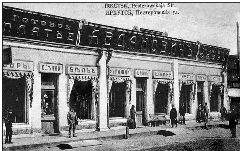
Фото 2. Иркутск, улица Пестеревская (ныне ул. Урицкого)

В старину деревенские вывески были выполнены в стиле «наивной, примитивной живописи» — предметы рисовались ча-