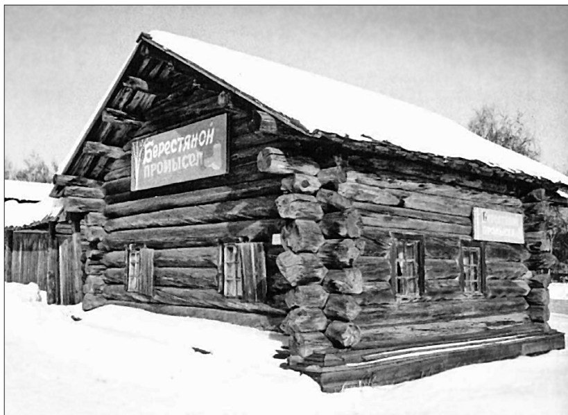
Фото 6. Дом в музее «Тальцы» (конец XVIII – начало XIX в.), в котором работают мастера берестяного промысла

правила применимы и для оформления более мелких элементов в экспозициях: аннотаций к выставкам, указателей, различных табличек, этикетажу, пояснительных текстов. Так же тщательно подбирается цвет бумаги и картона для текстов — берется чуть желтоватая, как бы состаренная, фактура фона. Со временем выработался и сложился «фирменный» шрифт, наиболее приемлемый в экспозициях АЭМ «Тальцы», — это курсив, кириллица, иногда модерн и антик. Например, кириллица использована в деревянных указателях-стрелках, показывающих посетителям направление движения по обширной территории музея и обозначающих названия главных экспозиций (фото 8). С самого основания музея художником В.Е. Нефедьевым для указателей было выбрано верное художественное решение — в виде верстовых столбов. 20 лет простояли они на открытом воздухе, дерево обветшало, почернело и сгнило, реставрировать указатели уже не имело смысла, пришлось заменить их аналогичными новыми. Художник А.А. Фролов использовал для столбов дерево лиственницы, которое практически не гниет (старые изготовлены из сосны). Были введены некоторые усовершенствования — вся конструкция была обработана BELINKA TOPLASUR — средством,