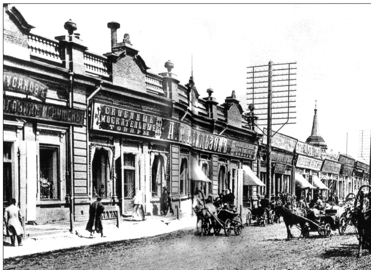
Фото 3. Иркутск, улица Ивановская (ныне ул. Пролетарская)

сто неправильно, в силу умения того или иного мастера, но были при этом старательно прорисованы. Изображались различная снедь (фрукты, кренделя, сыры, окорока, колбасы) и прочий товар (скобяные изделия, самовары, платье, обувь). «Неправильность» придавала старинным вывескам особое очарование, теплоту, искренность. Они не были назойливы (как современная реклама), хотя выполняли ту же функцию — позвать, привлечь внимание покупателя. Часто вывеска представляла собой цельную, законченную композицию и была самоценна сама по себе. Вспомним самобытного грузинского художника Пиросмани, рисовавшего свои маленькие шедевры в начале XX века в Грузии и ставшего известным именно как художник, писавший вывески.