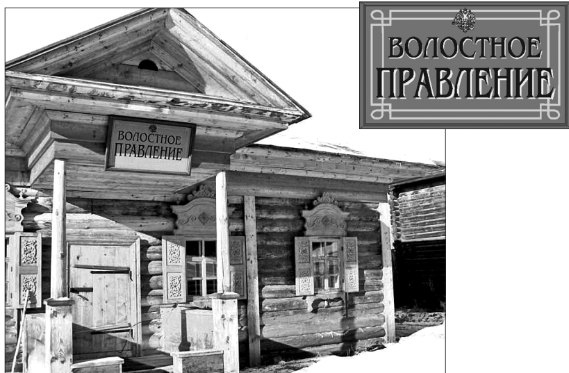
Фото 4. Здание волостного правления в музее «Тальцы»

Чем руководствуется художник, создавая вывески для музейной экспозиции? Прежде всего выбирается материал, из которого создается вывеска. Он должен быть натуральным: дерево, металл, фанера, в крайнем случае ДВП. Безусловно, в настоящее время