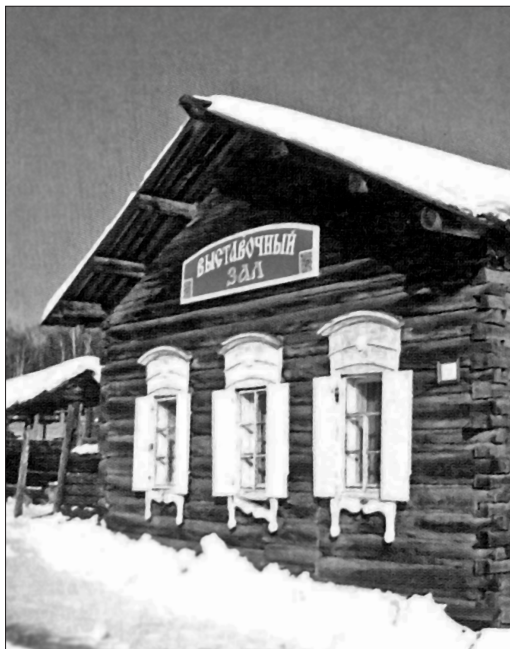
Фото 5. Выставочный зал № 1 в музее «Тальцы»

рекламный рынок располагает множеством удобных и прочных синтетических материалов — цветных полистиролов, плит KOMATEX, поликарбонатных пластиков, виниловых пленок типа «ORAKAL» и т. д. Но все это великолепие при попытке применить его в музее не оправдало себя. Выполненные из современных материалов вывески вносили дисгармонию в музейный ландшафт, вырывались из него, диссонировали. Синтетические фактуры, яркий, флюоресцентный, неестественный цвет — все это смо-