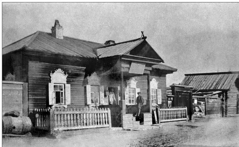
Фото 1. Волостная управа. Село Бельск Иркутской губернии. Начало XX в.

Сохранились редкие старинные фотографии, на которых можно увидеть торговую площадь волостного села с лавочками, присутственными местами и вывесками на домах (фото 1).