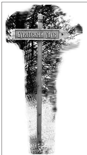
Фото 8. Стрелка-указатель в музее «Тальцы»

по аналогу, свозились со всей области. Реставрация здания управы была в 2006 году завершена, и усадьба открыта для посетителей. Перед художниками стояла ответственная задача — создать вывеску «Волостное правление», которая будет открывать экспозицию и давать понимание посетителю, что перед ним государственное, облеченное властью казенное учреждение. Был разработан и утвержден на ученом совете эскиз вывески (фото 4). Основа для вывески была заказана в реставрационную мастерскую (обычно эту работу исполняют в собственном столярном цехе на территории музея). Реставратором (Р.А. Давыдов) был изготовлен планшет, обтянут жестью, загрунтован, обрاملен в профилированную раму. Возникла проблема — мастер применил электрофрезер для создания фигурного профиля рамы, а в старину профили выводились вручную, специальным инструментом — калёвкой. Пришлось вернуться к старинной технологии. Затем художником (О.Ю. Фролова) вручную был прописан фон (зеленым хромом — традиционный цвет для официальных вывесок конца XIX — начала XX в.), прорисованы шрифты со светотенью, герб Российской империи.