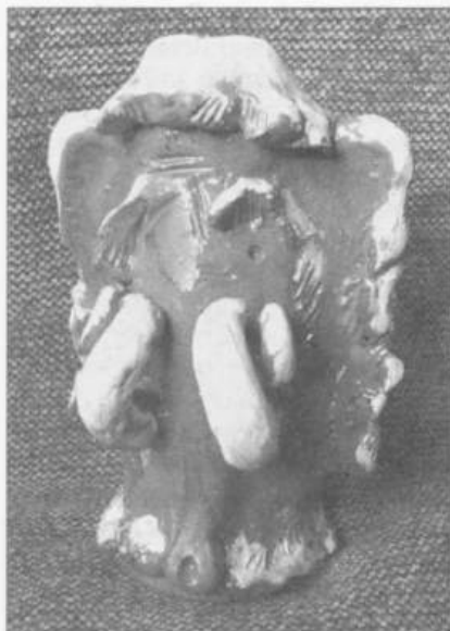
Мамонт. Автор Н. Соколов

легкой судьбе «нерпы-птицы», которая сначала умела летать, а затем потеряла эту способность и осталась навеки в гостеприимных байкальских водах. Дымленные игрушки, выполненные без лишних деталей, декорируются по поверхности тиснением древнерусскими символами, являющимися в основном солярными и охранными знаками. Это роднит их с архаичными глиняными изделиями мастеров традиционных народных промыслов Центральной России. Можно сказать, что древние русские традиции продолжают сегодня в Сибири.