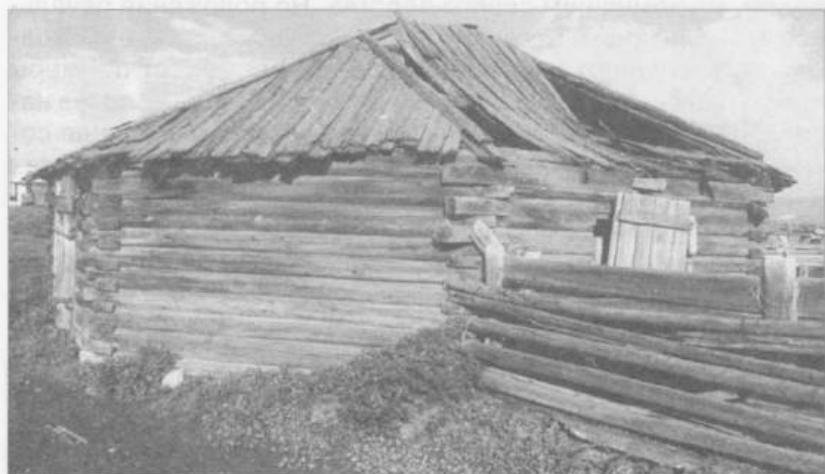
Фото 1. Бурятская юрта. Конец XIX в. Остров Ольхон, пос. Халгай. Фото И.Ю. Бержинского, 1994 г.

какой-то степени обусловили формирование такого феномена, как единая массовая общечеловеческая культура, практически захватившая основные позиции современной цивилизации, что приводит к окончательной утрате человечеством своих национальных корней. Значительную роль в исчезновении материальных форм традиционной народной культуры играют современные, отличные от традиционных, методы и принципы градостроительства. Интенсивно способствуют изменению историко-культурной среды пожары, целенаправленные разрушения — уничтожение построек для освобождения места под новое строительство — заводов, гидроэлектростанций, новых городов и т. д. Политические решения (характерные в основном для недавнего прошлого России) по уничтожению культовых построек и неперспективных деревень довершают картину изменения облика населенных пунктов, коренным образом меняют характер исторической среды обитания человечества, архитектуру населенных пунктов, исторический ландшафт. Катастрофически быстро исчезают из нашей жизни, буквально на глазах одного поколения, многие элементы человеческой материальной культуры (в некоторых случаях уже безвозвратно утеряны). В особенно плачевном состоянии в силу своей специфики — недолговечности, и уже по большей части утраченным оказалось деревянное зодчество.