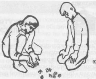
Рис. 2. Дети, играющие в лодыжки. Рис. Е. Киселёвой

Записанный нами на территории Республики Бурятия вариант игры отличается от тех, в которые играют буряты. Судя по сопоставительным справочникам, наш вариант близок описанию игры, бытовавшей в Вятской губернии. Из чего делаем вывод: игра пришла в описываемую местность из Центральной России, предположительно от выходцев из Вятской губернии.