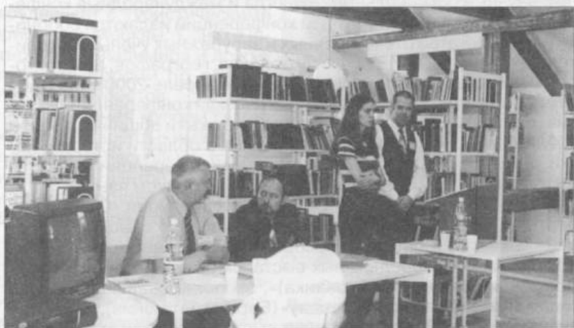
Научная конференция «Сарепта и народы Поволжья в истории и культуре России». 2001 г.

В настоящее время музей-заповедник занимает территорию 10,4 гектара, в его состав входят 29 зданий — памятников истории и архитектуры XVIII—XIX веков. Структуру музея составляют: фондовый, научно-методический, экспозиционный, туристско-экскурсионный, редакционно-издательский отделы, Экспериментальная немецкая библиотека, центры национальных культур, типография, автохозяйственная часть, служба безопасности и некоторые другие подразделения, общей численностью около ста человек. К услугам посетителей и гостей «Старой Сарепты» работают гостиница, кафе и небольшая автостоянка. Объем музейных коллекций составляет 20 тысяч единиц хранения. В собрании фондов музея имеются коллекции экспонатов, отражающих историю колонии Сарепты и этнографию населявших ее народов, научный архив и библиотека, видеотека, фонотека, фотоархив, документальные материалы по истории немцев Поволжья, колонии Сарепты и Красноармейского района Волгограда, архив музея-заповедника «Старая Сарепта», именные ар-