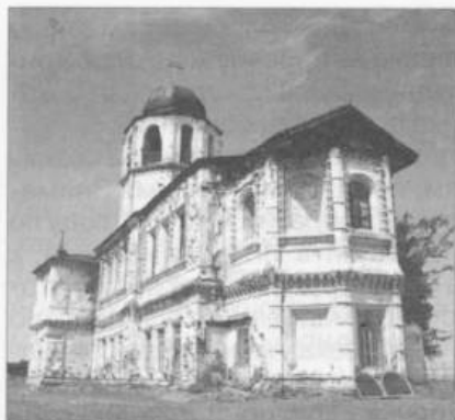
Спасо-Преображенский собор. 1773–1778 гг. Фото В.В. Тихонова, 2002 г.

императора Петра I передачи во владение монастыря земель под пашню и сенные покосы по берегу Байкала от Прорвы до речки Тимлюй, а также места для рыбной ловли в Корчинском соре и по берегу моря. Кроме того, он построил для настоятеля и братии келии, отдал во владение монастыря скотный двор с 35 лошадьми и всей упряжью, находящийся в 20 верстах от монастыря.