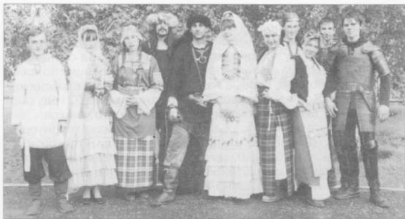
Участники международного фестиваля национальных культур «Сарептские встречи-2001».

живы, ботаническая и энтомологическая коллекции, экспонаты и материалы по Великой Отечественной войне, сталинским репрессиям и депортации немцев Поволжья. С перечнем наиболее ценных коллекций, изображениями наиболее уникальных экспонатов, их аннотациями и общей информацией о работе музея можно ознакомиться в компьютерной сети Интернет.