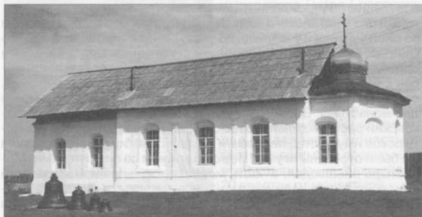
Никольская церковь. 1802–1812 гг.