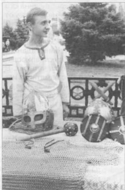
«Старая Сарепта». Выставка творческих работ народных умельцев «Аллея мастеров». 2001 г.

нальных традиций и языков. Практически при каждом из центров имеются свои творческие коллективы и объединения. Общее их количество на сегодняшний день — 27, число проводимых мероприятий в год — 152. Ежегодно музеем проводятся фольклорные праздники и, начиная с 1995 года, международный фестиваль национальных культур «Сарептские встречи». В 1999 году комплексный музейный проект «Сарепта — оазис для пяти народов, три века добрососедства и согласия» стал победителем конкурса «Европа — общее наследие», проводимого под эгидой Совета Европы, Европейского союза и Фонда бельгийского короля Бадуина, и получил денежный приз в размере 6 тысяч евро. В течение последних трех лет музей неоднократно выигрывал гранты РГНФ и Фонда Сороса.