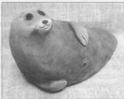
Нерпа. Автор А. Голендеев