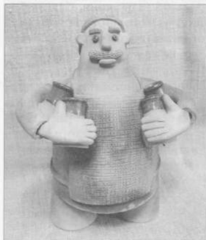
Гончар. Автор Г. Борисов

нимаются педагогикой, поэтому в промысле работают в основном в летнее время.