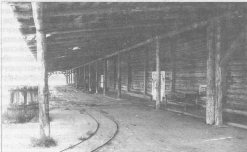
Фото 3. Первый этаж рыбозасоленного цеха. Остров Ольхон, пос. Песчанка. Фото И.Ю. Бержинского, 1996 г.

На озере Байкал есть большой (92 x 18 км) экзотический остров Ольхон. С незапамятных времен его населяли палеоазиатские племена. С XII по XIV век основным народом, проживающим здесь, стали буряты. Тюркоязычная культура бурят уникальна. В качестве жилища они используют, так же как и некоторые алтайские народности, деревянные юрты (фото 1). Еще пять лет назад на Ольхоне стояли две замечательные восьмистенные деревянные юрты (конец XIX в.) с остроконечными крышами, стропильная конструкция которых значительно отличалась от таковой на материке. Попытка автора вывезти юрты в музей не увенчалась успехом. Их просто приватизировали местные жители. Разобрали, перевезли в другие места. На одну собранную юрту соорудили железную крышу и используют как склад. Другую юрту вообще используют как стайку для поросят. Вот такое отношение к своей народной культуре. А с уничтожением в 1999 году деревянного здания рыбозавода (фото 2, 3) в поселке Пес-