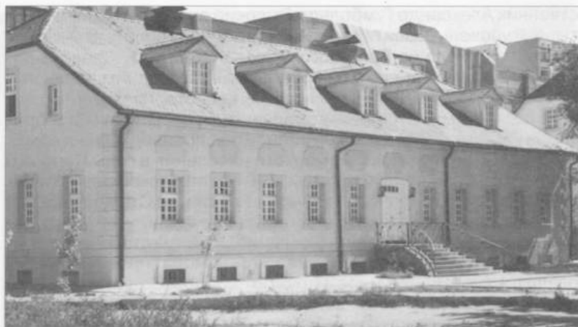
Здание общинной управы бывшей колонии Сарепта, 1779 г.