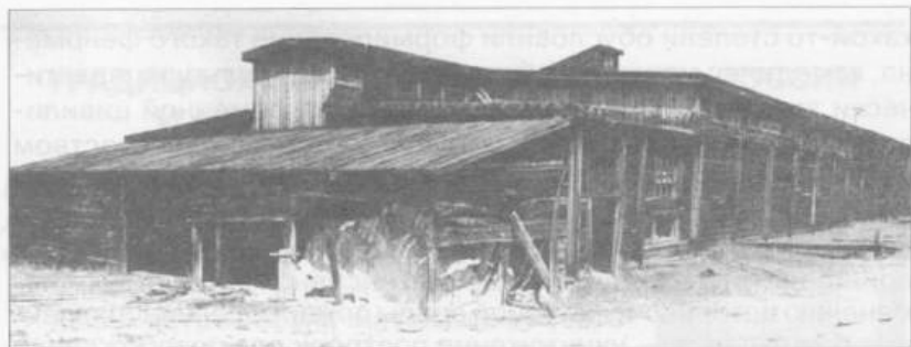
Фото 2. Морозильные камеры и рыбозасолочные цеха Маломорского рыбозавода. Остров Ольхон, пос. Песчанка. Фото И.Ю. Бержинского, 1996 г.

К концу XX века Россия потеряла более 80 % деревянных храмов, зафиксированных до 20-х годов XX века.