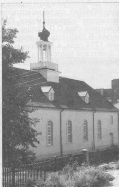
Сарептская кирха, 1772 г.

В августе 1987 года с инициативой организации музея истории Сарепты-Красноармейска выступила Комиссия содействия охране памятников истории и культуры при Красноармейском райсовете Волгограда. Была создана инициативная группа. Начались предварительные работы по сбору и обработке предметов старины, архивных документов и других будущих фондовых музейных материалов. В сентябре 1988 года Красноармей-