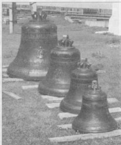
Колокола для Спасо-Преображенского собора. 2002 г.