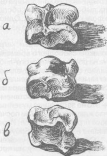
Рис. 1. Положения лодыжек: а — лунка, б — горбак, в — шарога. Рис. Е. Киселёвой

Второй этап игры. Первый по праву игрок берет кости свои и другого игрока, катает их и смотрит на их расположение. В «лодыжах» различают три положения сторон: «лунка», «горбак», «шарога» (рис. 1). Если кость стала углублением вверх — это «лунка» (а), если кверху наиболее выпуклой стороной, спиной — «горбак» (б), если боковой плоской стороной — «шарога» (в).