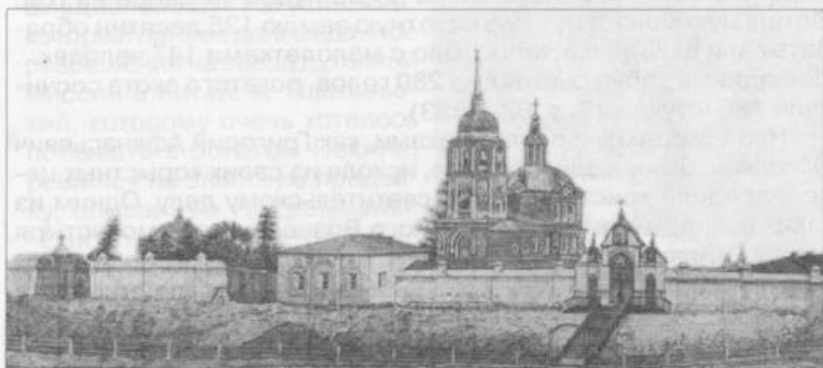
Посольский монастырь на восточном берегу озера Байкал. Рисунок из неизвестной книги

До своей смерти Осколков успел экономически поднять Посольский монастырь. Будучи в 1707 году в Москве, он добился у