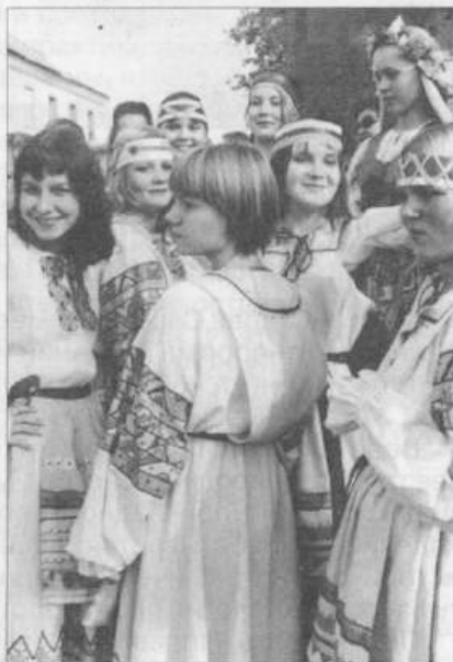
«Сарептские встречи-2001». Любанский ансамбль народной песни «Ярыца» (Беларусь).

При музее работает пять национально-культурных центров: немецкий, русский, украинский, татарский и калмыцкий. Центры занимаются изучением и возрождением нацио-