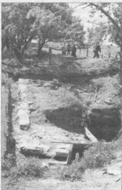
Раскопки в монастырском саду.