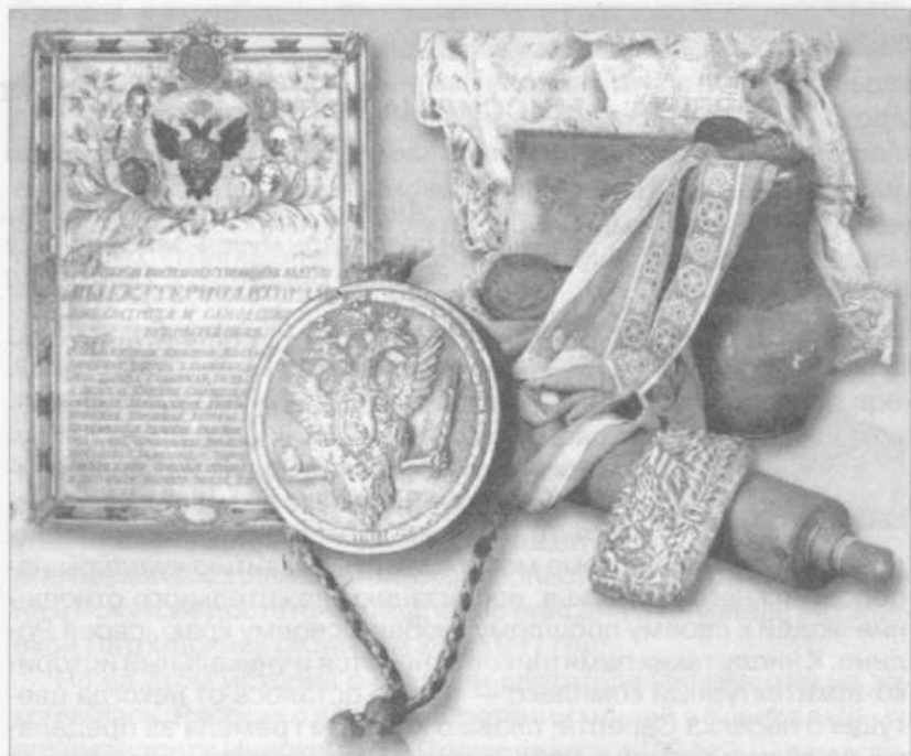
Жалованная грамота Екатерины II. Вещи первых поселенцев

стали выращиваться в Сарепте. Сарептский бальзам, горчичный порошок и масло, ткань «сарпинка» получили известность далеко за пределами государства. На протяжении конца XVIII–XIX века учебные заведения в колонии считались образцовыми, лучшими в регионе, а уровень образования и воспитания молодежи — высоким. Кроме школьного, некоторые сарептяне имели высшее образование. К началу XX века насчитывалось до 50 ученых, писателей, художников и музыкантов — выходцев из Сарепты. Ученые-колонисты достигли крупных успехов в области медицины, химии, физики, технологии промышленных производств, в выведении новых сортов культурных растений. Среди сарептян были историки, археологи, этнографы, лингвисты, зоологи, орнитологи, энтомологи и ботаники. Организованный в 1775 году близ Сарепты курорт минеральных вод в течение многих лет являлся местом отдыха и лечения российской аристократии. С научно-познавательными целями колонию посещали многие крупные ученые, писатели и путешественники России. Гостем Сарепты был и обладавший мировой известностью ученый и путеше-