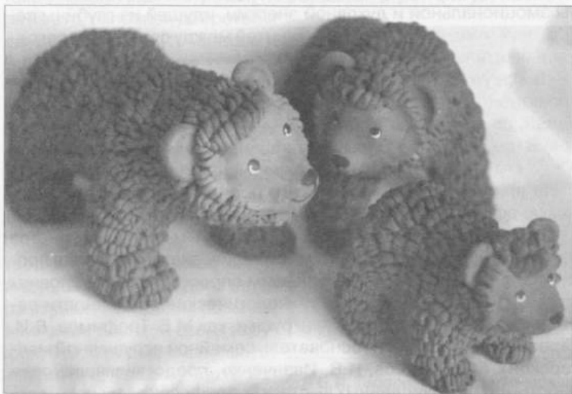
Б.Б. Фридман. Медведи. Терракота, ручная лепка, 1990-е гг.

Доступная по материалам и технологиям для сферы детского и подросткового досуга, глиняная игрушка стала частью, а