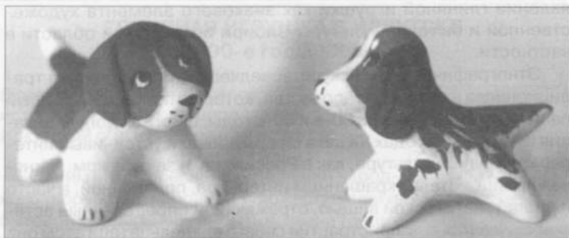
Б.Б. Фридман. Собачки. Глина, роспись

иногда и основой учебного процесса в художественных училищах и школах, в различных кружках и студиях. При всей неоднозначности этих явлений, обилия негативных сторон сегодняшнего функционирования глиняной игрушки (копирование, отрыв от традиционных центров производства, искусственное перенесение стилей на чужеродную почву, нарушение гармоничного единства творческого замысла и технологии) нужно отметить, что и в современном состоянии народная игрушка несет в себе отсветы эмоциональной и духовной энергии, идущей из глубины веков, служит одной из связующих нитей между прошлым и сегодняшними поколениями.