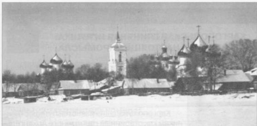
Вид Каргополя со стороны реки Онеги.

Между тем мастера были не просто ремесленники, понимали толк и в красоте. Они придерживались старых, проверенных поколениями форм и приемов лепки на ручном гончарном круге, технологии обжига в горне, обработки изделий различными способами для прочности и красоты. На продажу делали немалые партии, иногда до тысячи горшков. Просушивали посуду, обжигали на живом огне, а после обваривали в горячей мучной болтушке — солодяге , чтобы красно-коричневый черепок покрылся черными разводами-пятнами, делали также и зеленую свинцовую поливу. Выходило красиво и крепко. Потом укладывали посуду, а между нее и игрушку, в солому на сани-розвальни или в телегу, так и возили на ярмарку в город. По пути и в деревнях хозяйки выменивали кринку либо квашню на меру жита или овса. Сколько в посудину войдет — такова и цена.