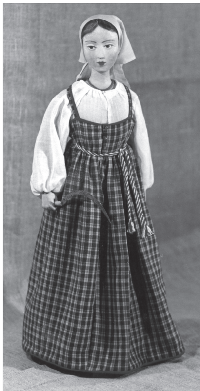
Крестьянка с серпом

приметой. Сейчас же редко в каком доме найдешь подобную самоделку.