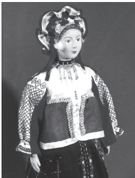
Кукла в традиционном costume жителей Тульской губернии

Чтобы общество окончательно не утратило своих народных корней, в последние годы музеями проводятся выставки традиционного народного костюма. Проходят фестивали народного костюма. Издаются каталоги и альбомы по народному костюму. Рассматривая варианты демонстрации и пропаганды традиционного народного костюма в экспозициях музеев под открытым небом, экспозиционеры большинства та-