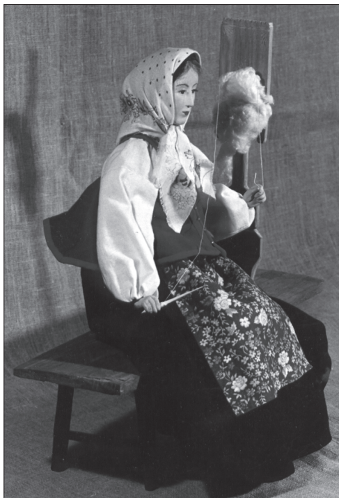
Сибирская крестьянка за прялкой

Современные способы изготовления кукол значительно расширились по сравнению с простой скруткой, хотя и до революции игрушечный мир был разнообразен: фарфоровые красавицы с наборами одежды, мебели, посуды; различные механические автоматы — музыкальные шкатулки, шарманки, клетки с поющими птицами, марширующие солдатики, железные дороги и т. д. Мастера были ничуть не хуже, а может быть — и лучше, чем современные. Кукольники и сейчас пользуются некоторыми