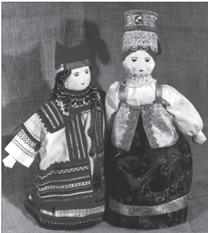
Куклы-скрутки в традиционных костюмах жителей Рязанской и Архангельской губерний

Горичева В.С. Куклы. — Ярославль, 1999. — 192 с.