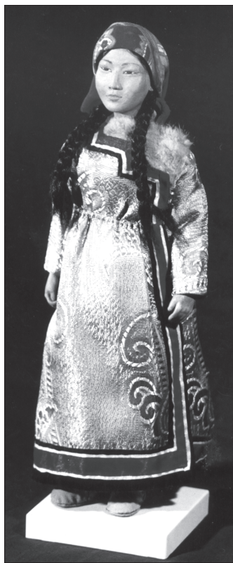
Кукла в традиционной тофаларской одежде

В последние десятилетия в мире широко распространяется коллекционирование кукол. Это хобби вполне можно использовать и для пропаганды традиционного народного костюма. Данное направление может также способствовать увеличению турпотока в музей. В этом плане в Архитектурно-этнографическом музее «Тальцы» разработан и реализуется проект оборудования мастерской под ткачество и производство сувенирных кукол. В воскресные дни в мастерской научный сотрудник-мастер будет показывать приемы изготовления домотканины на кроснах, а также приемы изготовления кукол. В настоящее время идет формирование коллекции кукол в традиционной народной одежде основных этносов, населяющих Предбайкалье. После формирования коллекции она будет демонстрироваться в специальных хорошо освещенных витринах в демонстрационной мастерской. За аналоги берутся экспонаты музеев, ретроспективные фотографии, рисунки, литературные описания. Существенная проблема при изготовлении уменьшенных копий ориги-