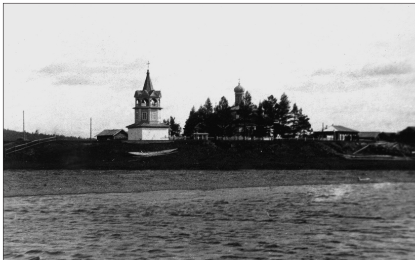
Чечуйская Воскресенская церковь. 1913 г.