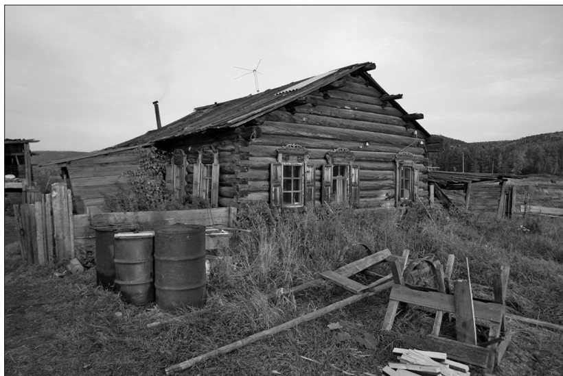
В деревне Кондрашиной. 2007 г.