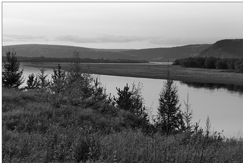
Река Лена возле деревни Кондрашиной. 2007 г.

Происхождение фамилии Бараков остается невыясненным. В XVII–XVIII вв. она встречается на Русском Севере. Например, в книге «Устюг Великий. Материалы для истории города XVII и XVIII столетий» среди других жителей этого города в 1670–1680-х гг. упоминается Мишка Сергеев Бараков. Кроме того, в ревизской сказке 3-й ревизии (1763) отмечен Захар Бараков, крестьянин Варженской волости Южской трети Устюжского уезда (8). Фамилия Бараков сохраняется в тех местах по настоящее время. В Кичменгско-Городецком районе Вологодской области по вторую половину XX в. существовал населенный пункт Баракovo.