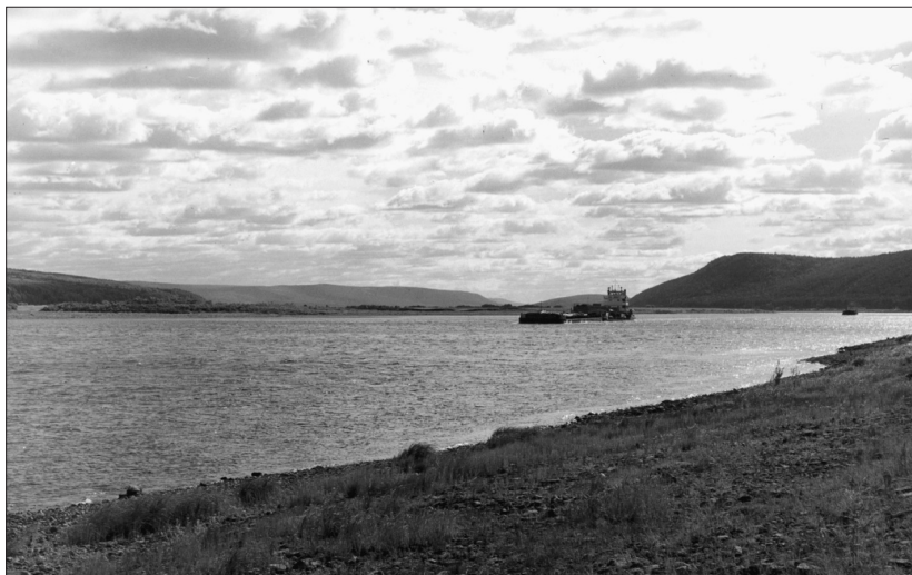
Река Лена вблизи Чечуйска. 2000 г.

ской области. Изучение же родословной Красноштановых привело к необходимости прояснить неизвестную до сих пор историю черкас — запорожских казаков, сосланных на реку Лену в XVII в., а это сегодня история международная. В 1638 г. черкасы из Украины, находившейся тогда под властью Польши, спасаясь от гонений поляков, вышли в Московское государство и были определены на русскую службу. Однако служба под началом русских воевод черкасам пришлась не по душе, и через три года они попытались бежать обратно в Украину. Часть из них была поймана, и дело кончилось тем, что в 1642 г. их сослали в пашенные крестьяне в Сибирь. Большая часть черкас, свыше 60 семей, попала на Лену, став основателями многих деревень и дав начало не одному ленскому роду.