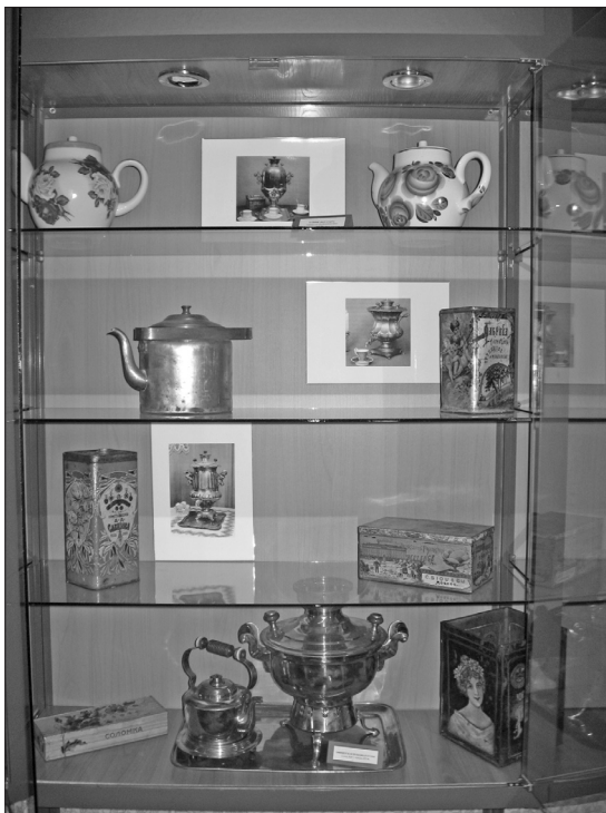
Жестяные банки и походная офицерская кухня. Фрагмент выставки.

Официальной датой появления чая в Иркутске можно считать 1684 год, когда к стенам острога подошел из Северной Монголии торговый караван. На 170 верблюдах были достав-