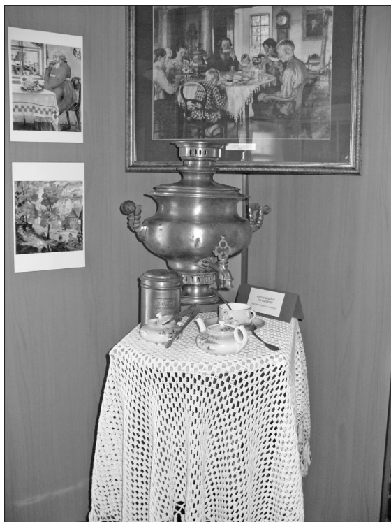
Столик, накрытый для чаепития. Фрагмент городского интерьера.

Доля чая в импорте в 1825 году составила 90 %.