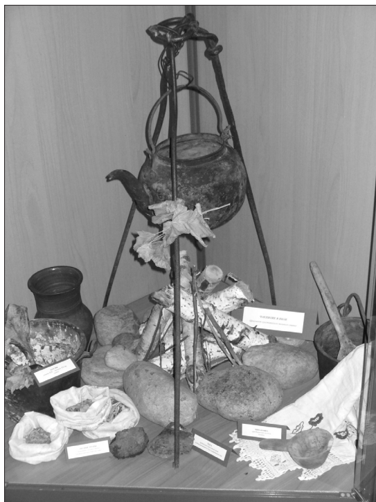
Чаепитие в поле. Фрагмент крестьянского полевого стана.

да тянуть против течения. Случалось, что канаты, с помощью которых поднимали суда вверх по реке, обрывались, и тогда нередко гибли не только грузы, но и люди, находившиеся на судах. На волоках дороги содержались в запущенном состоянии: заваленные камнями, лесом, с прогнившими мостами; зимовья, где купцы делали привалы, были безлюдны и „оттого приезжающие как в пище, так и в обогревании себя и в корму лошадином претерпевали великие недостатки“» (3, с. 177).