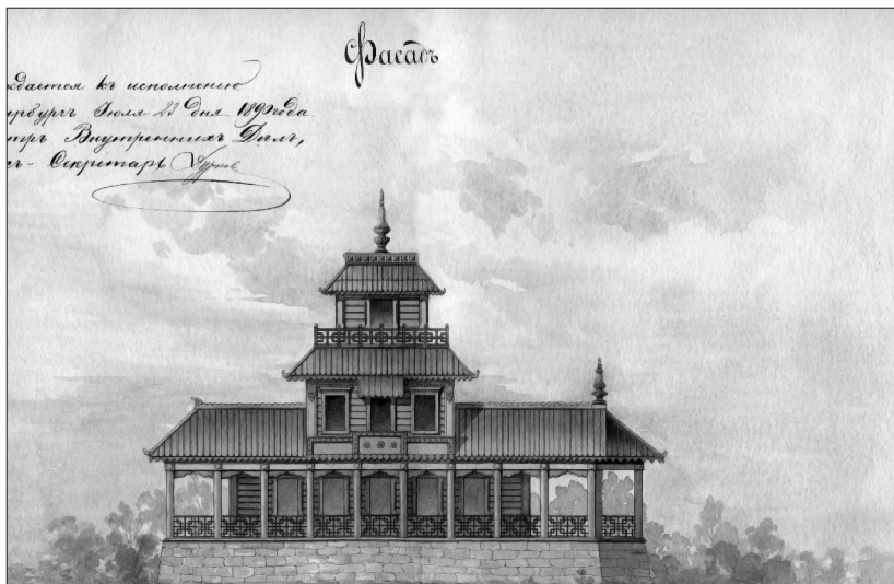
Фасад здания Аларского дацана, 1890 г.

генерал-губернаторства. Вследствие этого и возникли трудности с открытием дацана, и даже, как показали дальнейшие события, сама служба в Аларском храме ставилась под сомнение. Инструкция имела целью постепенно свести на нет практику, а с ней и влияние лам в Приангарье. Такое положение вещей позволяло проще и с меньшими препятствиями проводить русификацию этнического меньшинства. Видимо, по этой причине в секретном письме канцелярии иркутского генерал-губернатора балаганскому окружному исправнику сообщалось: «Освящение Аларского дацана должно быть произведено наивозможно скрытным образом, избегая всяких многолюдных церемоний и обрядов» (4).