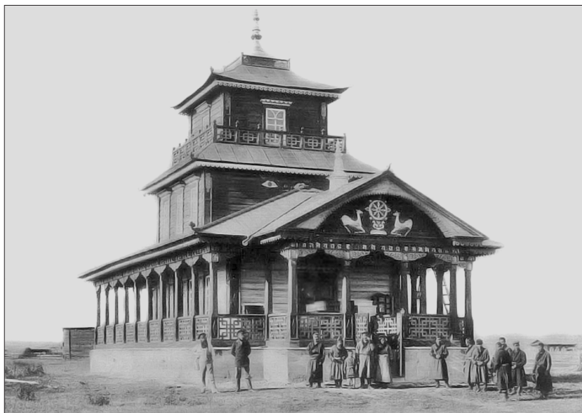
Аларский дацан, не позже 1902 г.

Наконец 18 сентября 1894 года все необходимые священные книги были доставлены в Аларский дацан. Среди них «Шунгин-Ном» — книга буддийских молитв. Теперь нужно было совершить обряд положения книг в Ганжур. Балаганский окружной исправник так описывает этот обряд: «Книги-свитки, в форме цилиндров — вышиною от одного до четырех вершков (вершок равен 4,45 см. — А. Ш.) и диаметром от \frac{1}{4} до 2\frac{1}{2} вершков, находились во вновь выстроенном дацане на столе, кроме сего были приготовлены — картонный футляр в форме конуса и ящик с порошком из какой-то пахучей травы коричневого цвета. Укладку книг производил ширетуй дацана с двумя ховараками; на четырехгранную деревян-